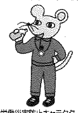
労働災害防止キャラクター プーイのび