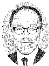
鳥取労働局 局長 山本浩司

鳥取県労働基準協会並びに会員の皆様、はじめまして。この4月から労働局長として着任しております山本浩司と申します。日頃より労働行政の推進に格段のご理解とお力添えを賜り、厚く感謝を申し上げます。