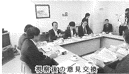
視察後の意見交換

視察後に意見交換を行い、腰痛予防対策が単に作業員の腰への負担を軽減するだけではなく、利用者へのサービスに繋がっていること、作業員への腰痛予防対策を利用者へのサービスのためと指導してその徹底を図っていること、「これだけ体操」の継続やメンタルヘルス対策の取組は、トップの決断が重要であることなどを確認して視察を終了しました。