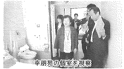
幸朋苑の個室を視察

視察では、高さが調節できるベッドを設置して、利用者の移乗作業に伴う作業員の腰への負担を軽減させるとともに、利用者の離床が楽になって社会復帰への意欲が促されていること、入居者の個室にトイレを設置して排泄作業を行うことで作業員の腰への負担となるおむつ替えの作業をなくし、同時に入居者の衛生面の向上やプライドの保護になったこと、要介護者の移乗にスライディングシートを使用することで作業員の腰への負担の軽減を図り、要介護者の床ずれの解消に繋がったことなどの説明を受けました。